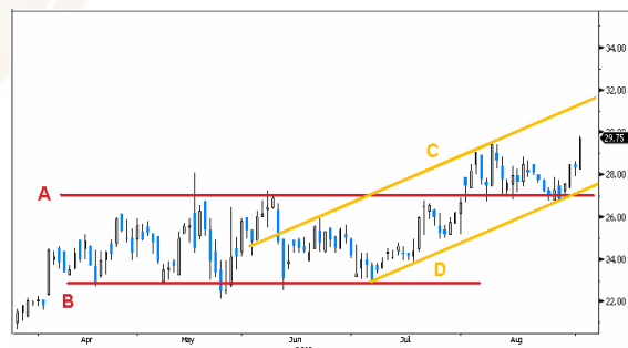
東方電氣 參考數據